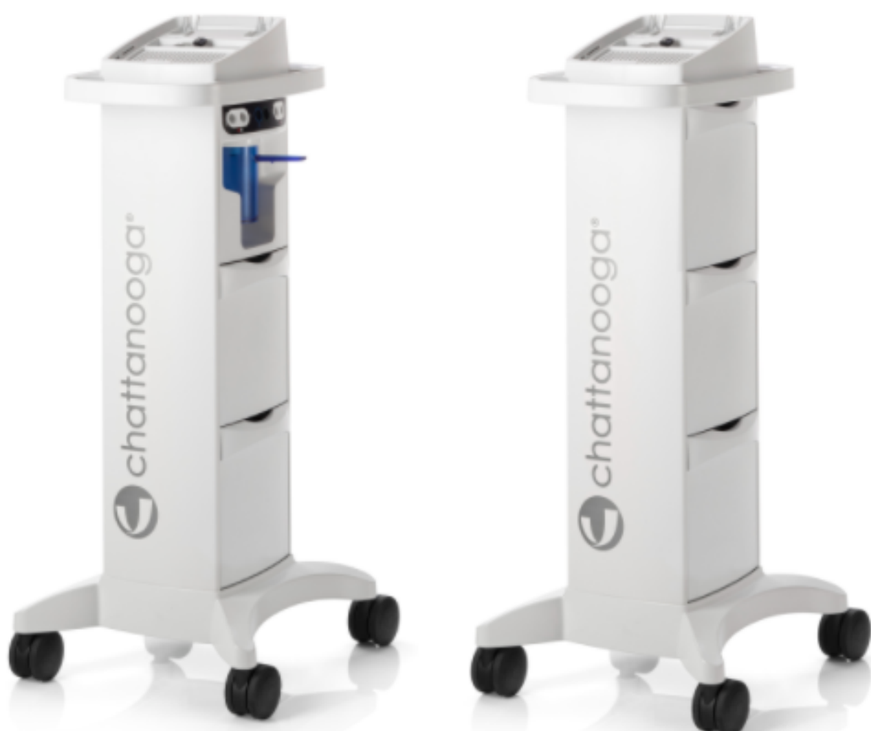
THERAPY CART WITH VACUUM